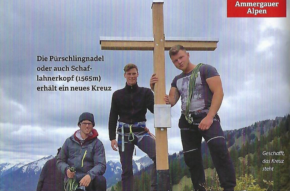
Geschäft, das Kreuz steht

Die Pürschlingnadel oder auch Schaf- lahnerkopf (1565m) erhält ein neues Kreuz