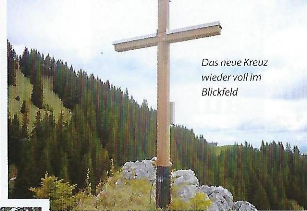
Das neue Kreuz wieder voll im Blickfeld